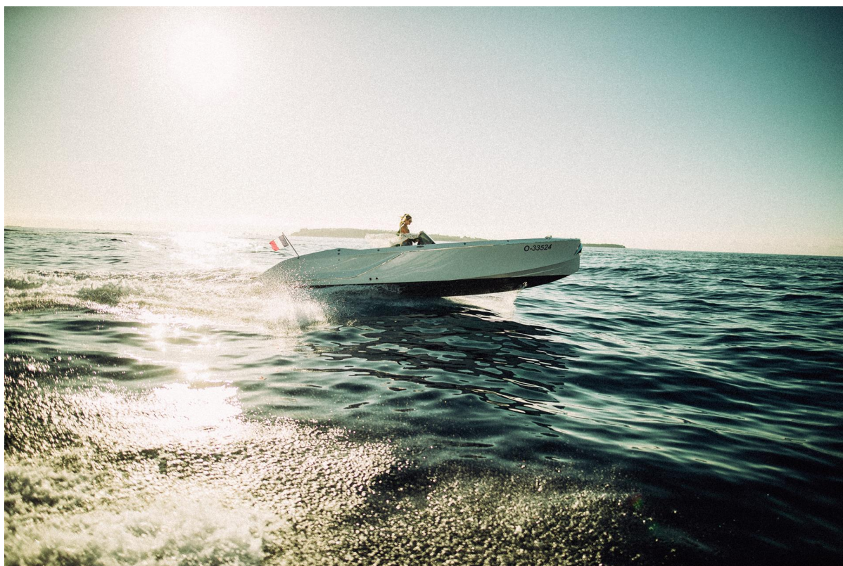
La nuova 858 Fantom Air

Accanto a Frauscher 858 Fantom Air era presente anche l' intera flotta Frauscher , a partire dall'ammiraglia 1414 Demon (offshore di quasi 14 metri), i modelli 1017 GT, 1017 Lido, 858 Fantom, il 747 Mirage, daycruiser sportivo e lussuoso disponibile anche nella versione Mirage Air. Insieme ai nuovi modelli anche i masterpiece 606 Riviera, 686 Lido, 757 St Tropez e 909 Benaco, classico runabout con innovativi elementi di design. Una 717 GT in livrea blu Bugatti era poi in esposizione all'ingresso del cantiere. Fatto straordinario e quasi unico, tutte le barche erano a disposizione degli ospiti per le prove in acqua.