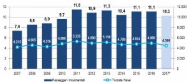
Il traffico crocieristico in Italia nel periodo 2007-2016 e previsioni 2017, passeggeri movimentati e toccate nave

Fonte: Riposte Terzino (2017), Speciale Crociera. Nota (*): previsioni basate su dati di porti che complessivamente nel 2016 hanno concentrato il 99,8% del traffico crocieristico (ed il 97,4% delle toccate nave). Passeggeri movimentati con valori in milioni.